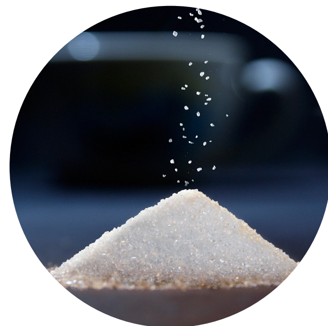
วิเคราะห์ น้ำตาลพื้นฐาน (Glucose, Fructose & Sucrose) (ลดพิเศษตลอดทั้งปี)

โปรมอซึนนีั้ยังไม่รวมค่าบริการเตรียมตัวอย่าง