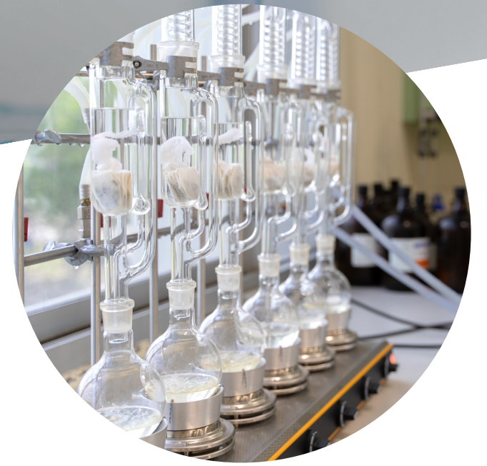
วิเคราะห์ องค์ประกอบทางเคมี กลุ่มลิกโนเซลลูโลส (กรกฎาคม - สิงหาคม)