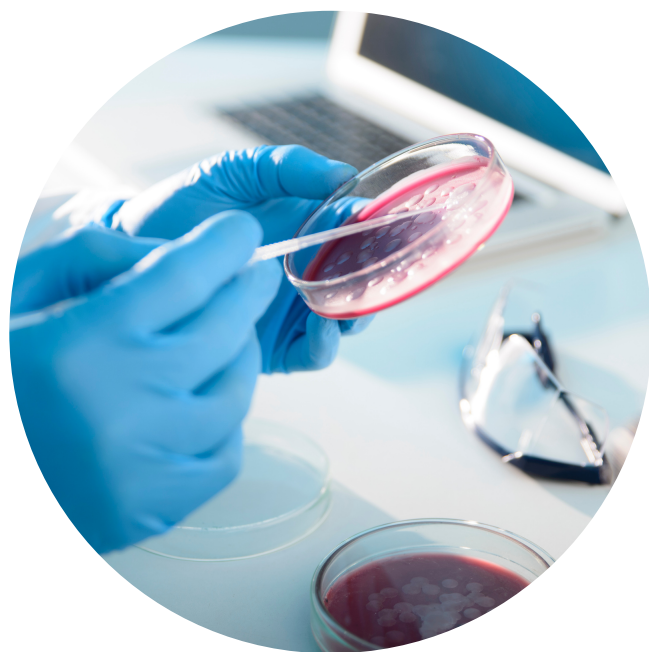
วิเคราะห์ ทางด้านจุลินทรีย์ (พฤศจิกายน - ธันวาคม)