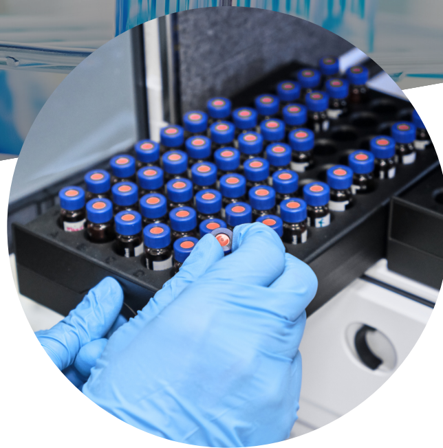
วิเคราะห์ องค์ประกอบทาง น้ำตาล (พฤษภาคม - มิถุนายน)