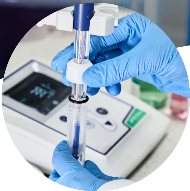
วิเคราะห์ องค์ประกอบทั่วไป และทางกายภาพ (มกราคม - กุมภาพันธ์)