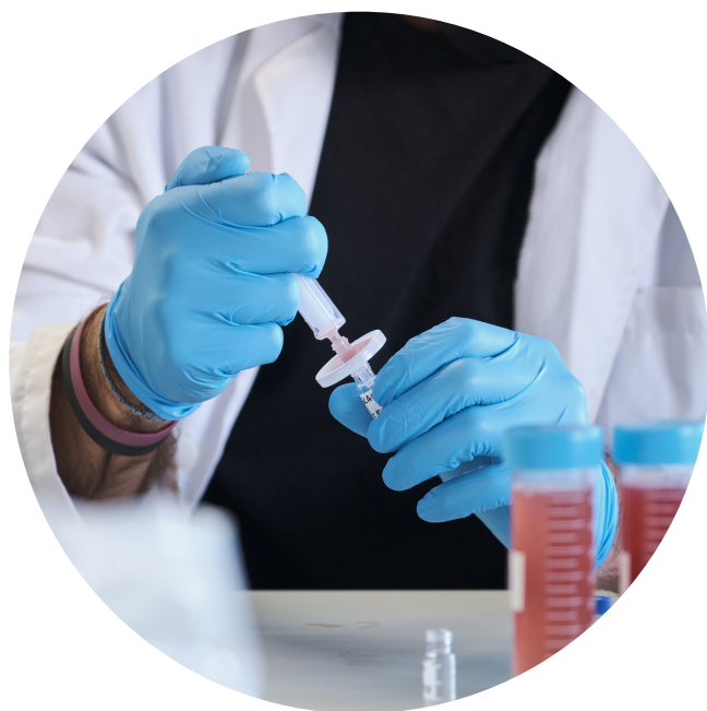
วิเคราะห์ น้ำตาลในกลุ่ม กลุ่มโอลิโกแซคคาไรด์ (กันยายน - ตุลาคม)